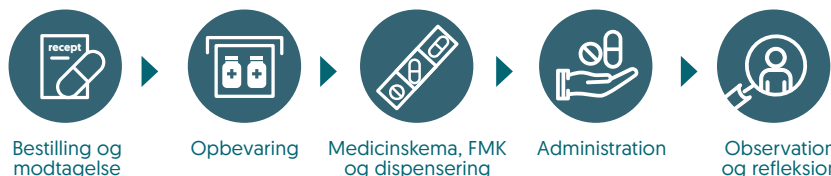
Illustration af en simpel medicinproces, Type2dialog.

Sundhedsfaglig chefkonsulent og farmaceut med speciale i kvalitetsudvikling på medicinområdet, strategisk rådgivning og analyse af medicin håndtering, patientsikkerhed, UTH mv. Hun har desuden en master i kvalitetssikret lægemiddel anvendelse.